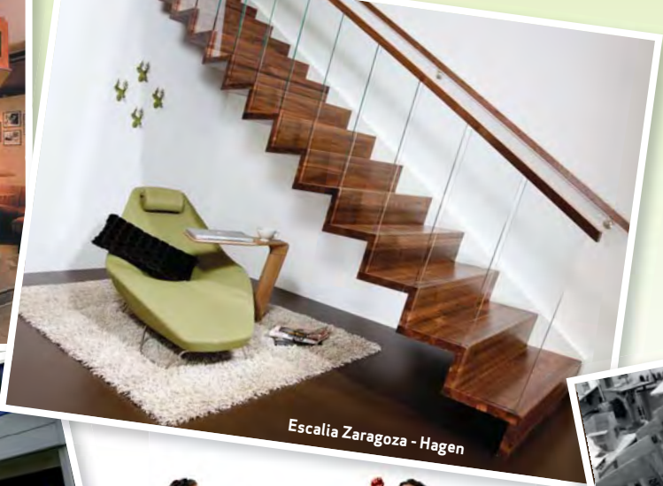
Escalia Zaragoza - Hagen