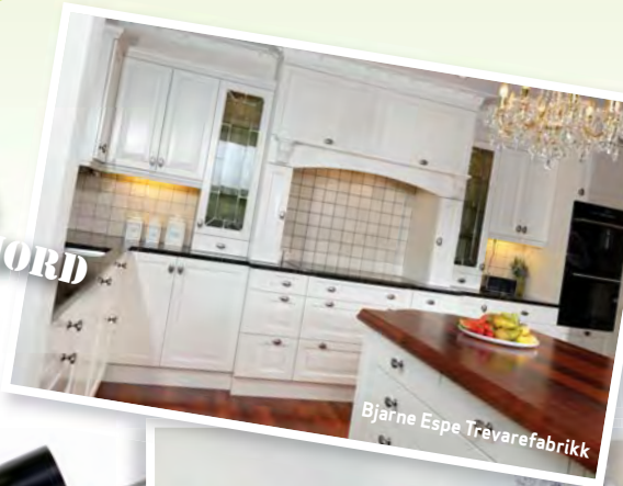
Bjarne Espe Trevarefabrikk