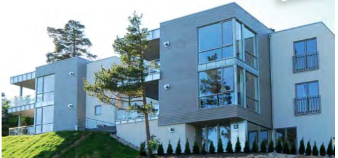
Norgesvinduet Bjørlo (leveranse)