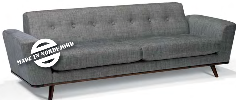
Stryn Møbelindustri - Dina sofa

Tre-design Treteknologi Industriell møbelproduksjon Industridesign Innovativ produktutvikling Robot-teknologi Kreativ produksjon